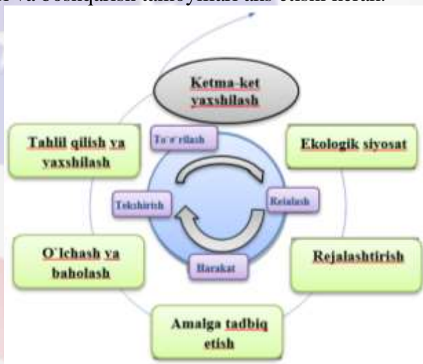
1-rasm. Ekologik menejment tizimi modeli sxemasi

ASK o'zining ekologik siyosatini belgilashi va atrof-muhitni boshqarish tizimiga oid majburiyatlarni o'z zimmasiga olishi kerak. Ekologik siyosat umumiy ma'noni aniqlaydi va korxonaning ushbu yo'nalishdagi printsiplarini belgilaydi. Atrof-muhit holati va tashkilot tomonidan talab qilinadigan ekologik samaradorligi uchun mas'uliyat darajasini belgilovchi maqsad belgilanadi va u orqali barcha keyingi harakatlar baholanadi. Unda korxonaning qadriyatlarini va boshqarish tamoyillari aks etishi kerak.