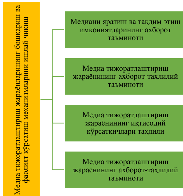
Расм 2. Медиа тижоратлаштириш жараёнининг ахборот таъминоти механизми